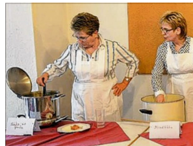
Vier Töpfe voller Suppe gab es beim Erntedankfest in Kutenhausen.