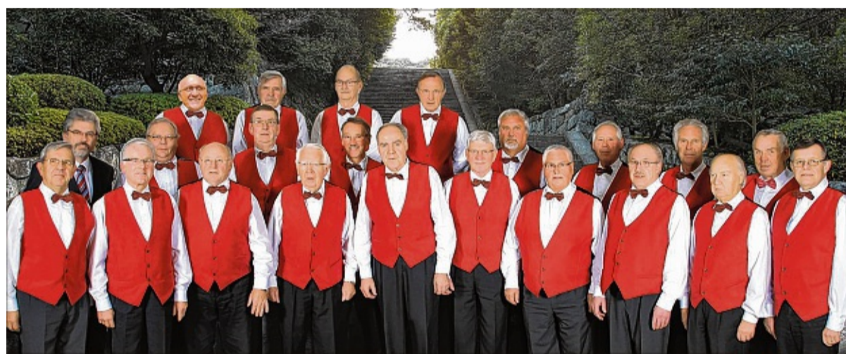
Lädt im Jahr des 120-jährigen Bestehens zum Abschiedskonzert in die St. Matthäus-Kirche in Minden ein: der Männerchor Meißen.

Der Jubilar hat auch zu diesem besonderen Konzert musikalische Gäste eingeladen. Das Trio „Engelstimmen treffen Teufelsgeiger“ mit Vale-